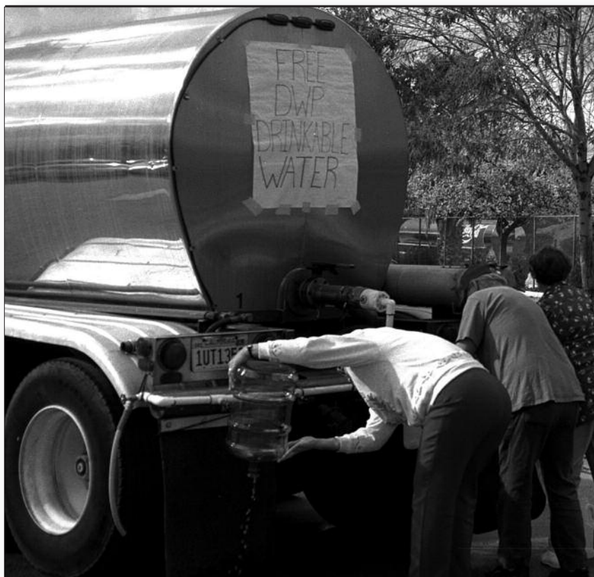
Agua potable gratis